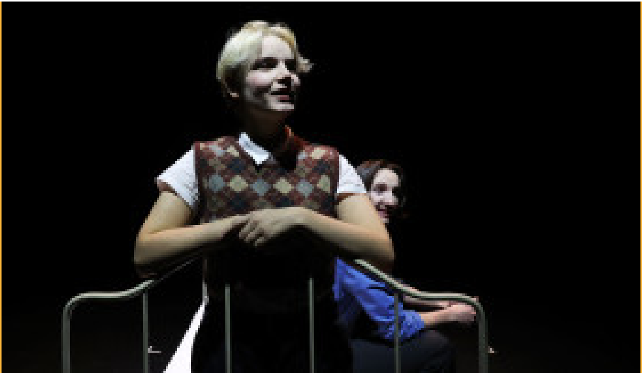
György Ligeti, entretien avec moi-même... (2023)