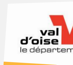
Conseil départemental du