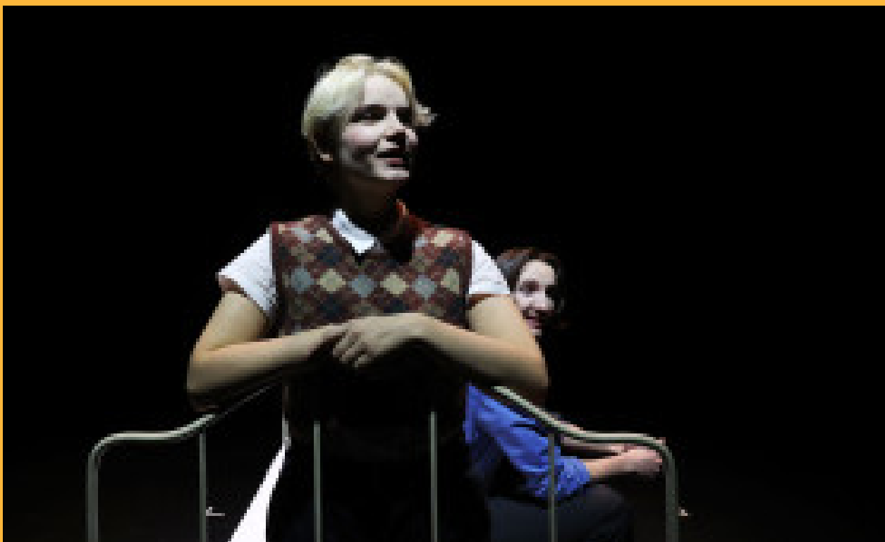
György Ligeti, entretien avec moi-même... (2023)