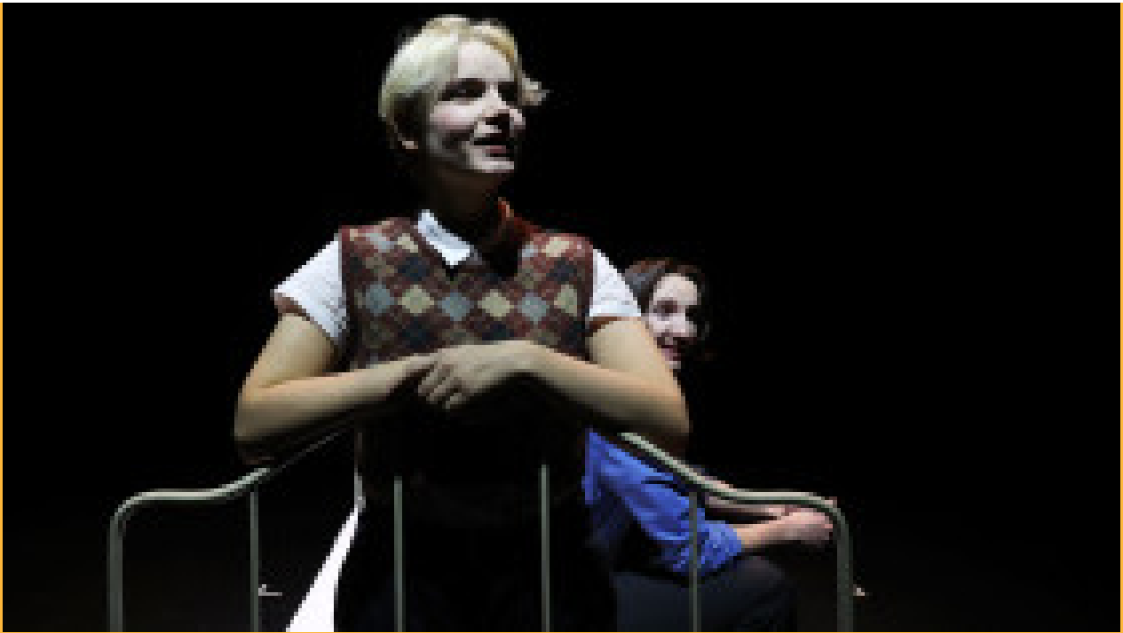
György Ligeti, entretien avec moi-même... (2023)