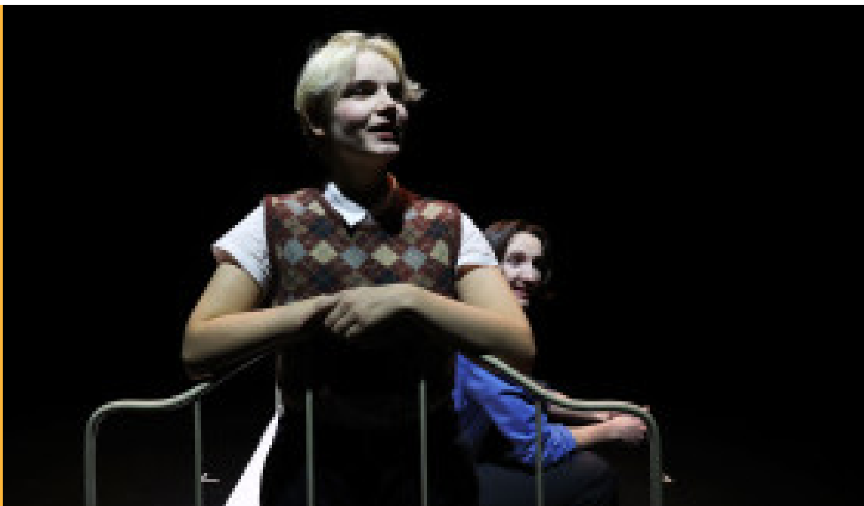
György Ligeti, entretien avec moi-même... (2023)